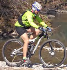
Cartignano - torrente Maira